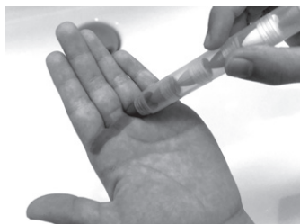
蛍光クレヨンをぬる。