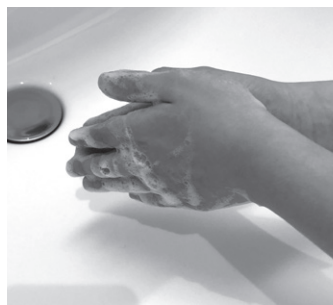
手を洗う。 ※正しい手の洗い方は下記をご覧ください。