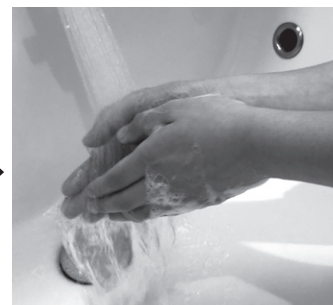
洗えていない部分を再度洗う。